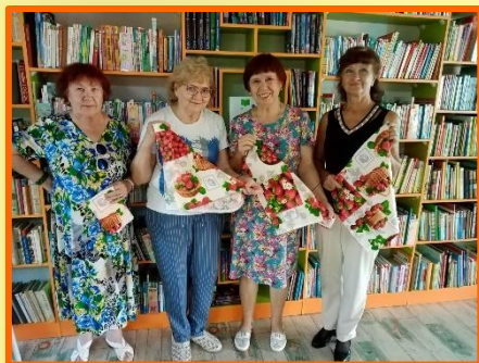
«Вкусный натюрморт» осенняя фантазия.