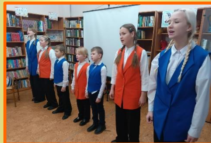
Праздничная программа «От сердца к сердцу» к Дню матери.