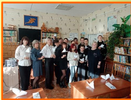
«Полотенце в каждом доме» мастер – класс